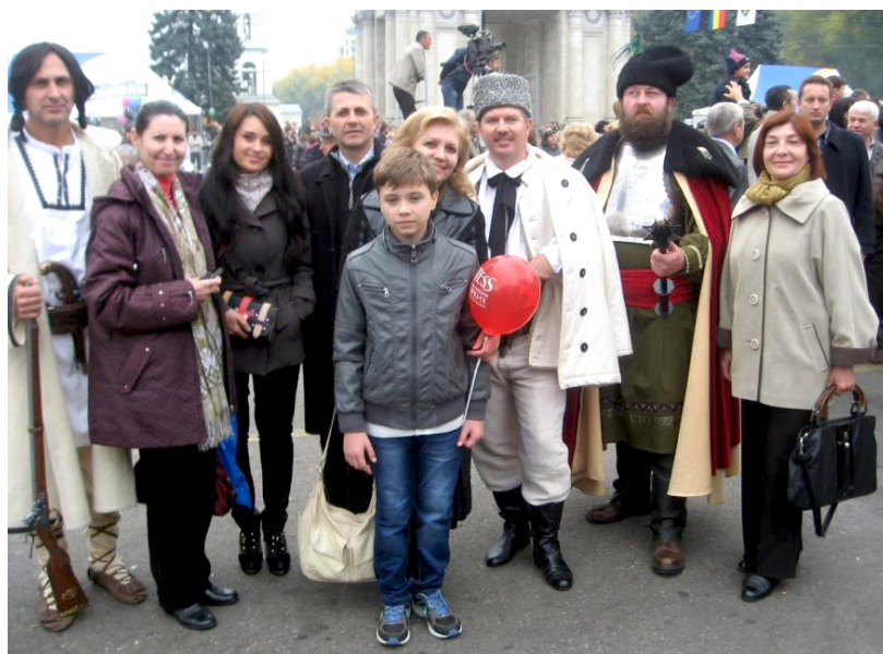
Alături de familie și prieteni.