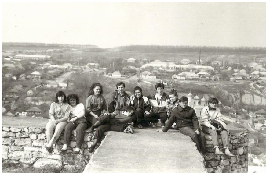
Pe ruinele cetății de la Orheiul Vechi.