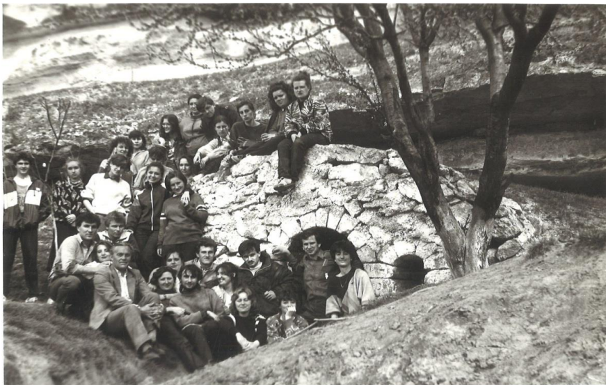
Un popas studentesc la Orheiul Vechi în anul V împreună cu colegii.

fundamentală în programul de studii la facultate în domeniul istoriei antice prin organizarea pe parcursul a mai multor ani a practicii arheologice a studenților și prin desfășurarea activităților de cercetare prodigioasă în cadrul expedițiilor arheologice în siturile de la Ulmu, Horodca X (raionul Ialoveni), Horodca Mică, Horodca Mare (raionul Hâncești) și Orheiul Vechi.