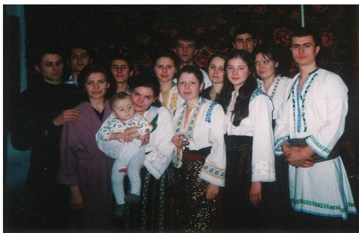
Studenții facultății cu colinde de Crăciun.

Fiind mentor al grupelor studențești, desfășoară o amplă activitate educativă cu discipolii: organizarea de excursii în muzeele republicii, a discuțiilor și convorbirilor individuale și în grup pe diferite teme actuale, desfășurarea „Balului bobocilor”, „Sărbătorii sarmalelor și plăcintelor”, alte activități cultural-educative. În permanență este preocupată de frecvența și reușita studenților, organizarea vieții lor cotidiene.