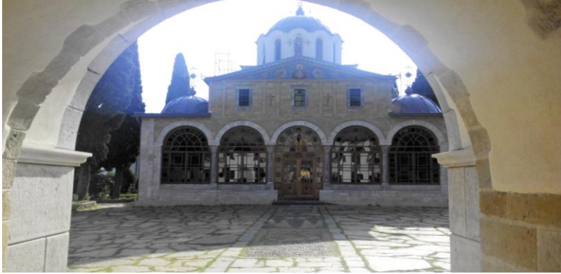
Biserica românească Sfântul Ioan Botezătorul