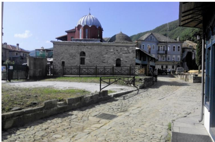
Peisaj monastic din cadrul capitalei Kareia

Muntele Athos este amintit încă în antichitate, în sec. VIII-VII î.e.n., de către Homer în Iliada . Creștinii valorifică acest teritoriu încă de la începutul prigonirilor în masă de către romani. Teritoriul servește drept refugiu pentru călugări, care s-au retras de pe întreg teritoriul bizantin, în vederea protejării icoanelor, în perioada anilor 726 – 843, când au fost interzise icoanele în lăcașele creștine. Din această perioadă Muntele Athos devine un loc de atragere a călugărilor și a mirenilor, care participă la edificarea așezărilor de cult religios.