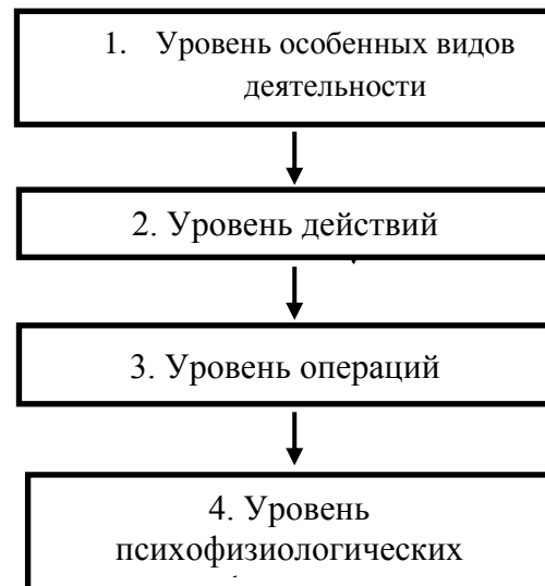
Рис. 1. Иерархическое строение деятельности

Представления о строении деятельности, которые мы приведем, не исчерпывают полностью теорию деятельности. Отправной идеей рассмотрения феномена деятельности, является то, что деятельность имеет сложное иерархическое строение. Деятельность состоит из нескольких уровней. Для выявления этих уровней воспользуемся «движением сверху вниз», где выделяются следующие четыре уровня (Рис.1):