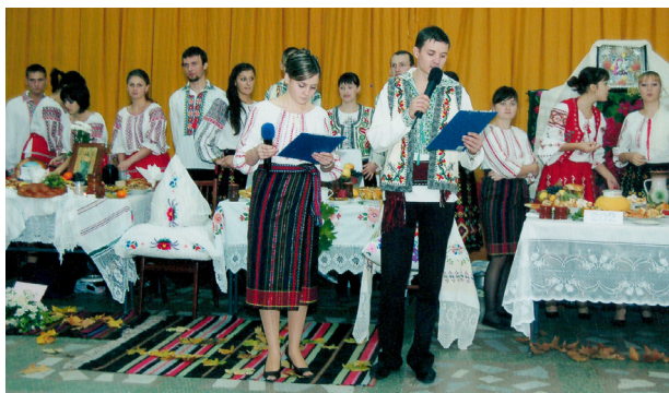
Secvență de la cea de-a VIII-a ediție a Sărbătorii sarmalelor și plăcintelor, organizată la UPS „Ion Creangă”, noiembrie 2010.

Competențele culturale ale studenților istorici și etnografi au fost consolidate prin variatele acțiuni educaționale extracurriculare. Au devenit tradiționale: Sărbătoarea sarmalelor și plăcintelor, șezătoarea „Misterul nopții de Sfântul Andrei”, „Să trăiți, să-nfloriți”, „Dragobete”, sărbătorile „Galbenă gutuie”, „O gingașă și mlădioasă floricea”, Hramul căminului studentesc, vizitarea monumentelor de istorie și cultură, a așezămintelor culturale etc.