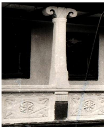
Fig. 4. Parapet al galeriei din piatră. s. Butuceni (Orhei).