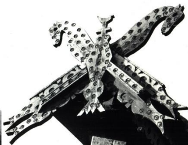
Fig. 1. Terminație de fronton. s. Chircăieștii Noi (Căușeni). Fig. 2. Fronton de poartă. s. Micleușeni (Nisporeni).

Ideograma solară reprezentată în formă de S este o altă imagine cunoscută atât în arta tradițională a popoarelor lumii, cât și în cultura tradițională românească. Este vorba de semnul supremei suveranități cosmocrate și cosmogonice. În acest sens, astrul suveran