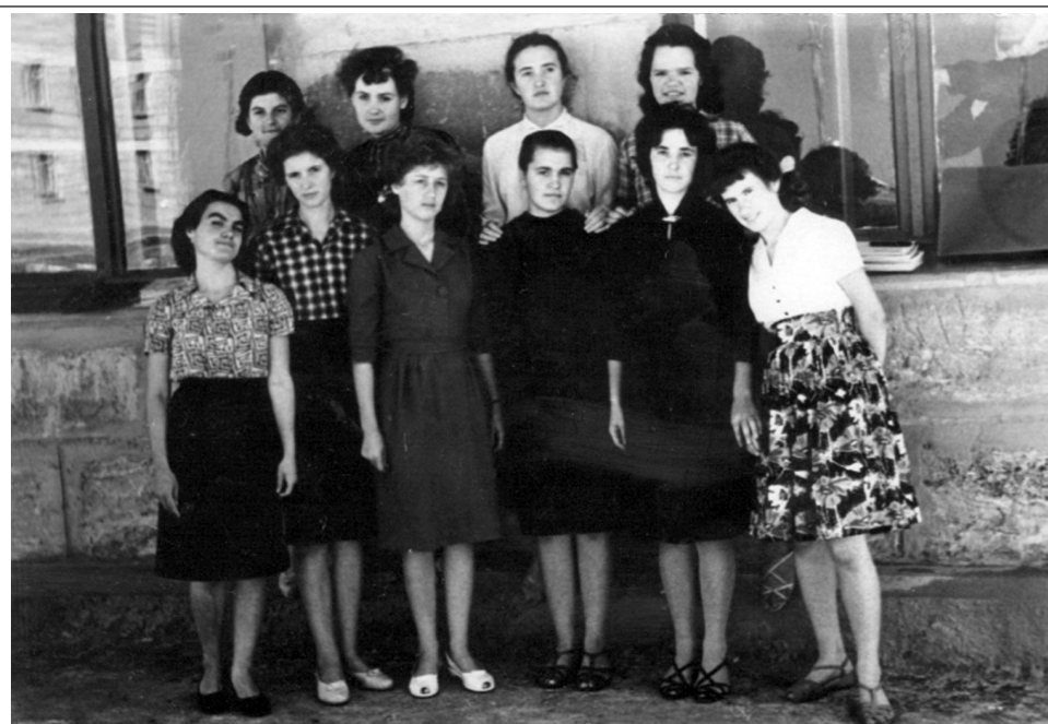
Împreună cu colegele de Facultate în căminul studentesc, 1962