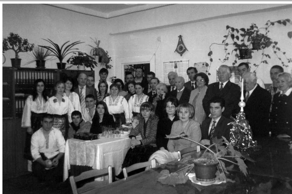
„Să trăiți, să-nforiți!”. Sărbătoarea de Crăciun și Anul Nou – 2007 la Facultate