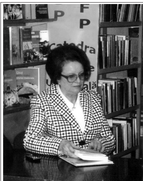
Moderatoare a atelierului „Artă și ideologie” în cadrul Conferinței științifice „Patrimoniul cultural național și universal: dialog istoric”, Chișinău, 13 noiembrie 2014

În anii '90 ai secolului trecut, după ce Republica Moldova și-a declarat independența, în tânărul stat se sim-