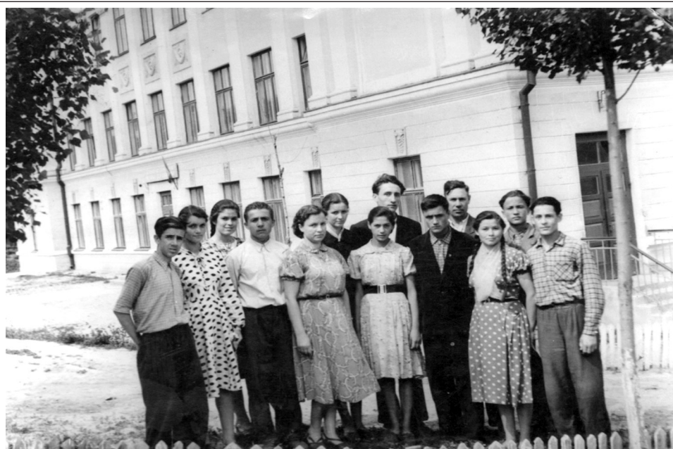
Împreună cu colegii din clasa a X-a A a școlii din l. Cotiujenii Mari, 1961