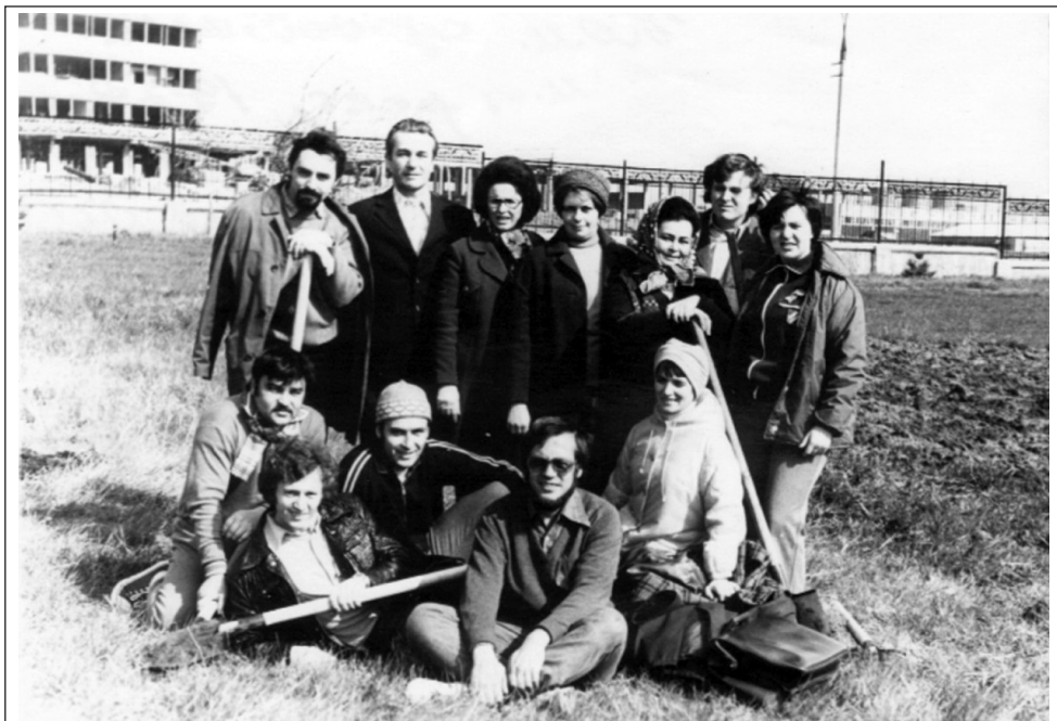
Cu colegii de la Institutul de Istorie al AȘM la subotnic în Grădina Botanică, 1979