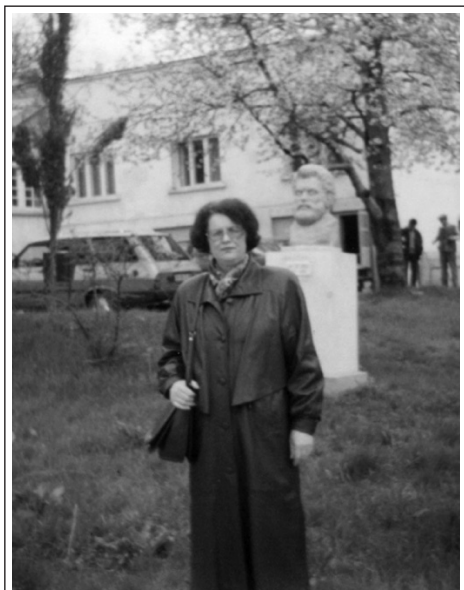
În timpul stagiului la Universitatea „A.I. Cuza” din Iași, 1999

problemă deseori era obiect de discuție la seminarul metodic al catedrei. Acumulând o anumită experiență în organizarea activității independente a studenților, ideile principale în vederea stimulării acestei munci le-a expus într-un articol publicat în ziarul „Învățământul public”, la rubrica „Școala superioară și restructurarea” 7 .