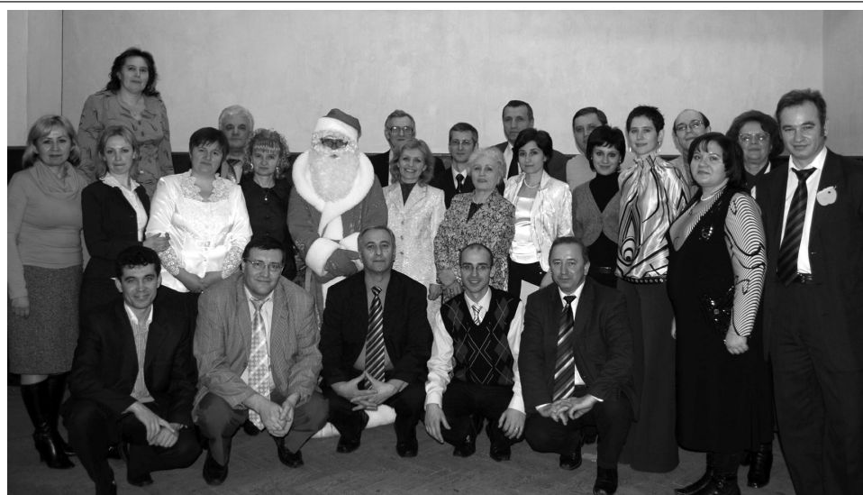
Revelion – 2009

Acest subiect, în vogă pe atunci, a fost mai târziu studiat multilateral, și în anul 1981, la Editura „Știința” a fost publicată lucrarea „ Activitatea artistică de amatori a populației din RSS Moldovenească ”. Ambele lucrări au văzut lumina tiparului sub redacția doctorului în științe istorice Vladimir Țaranov.